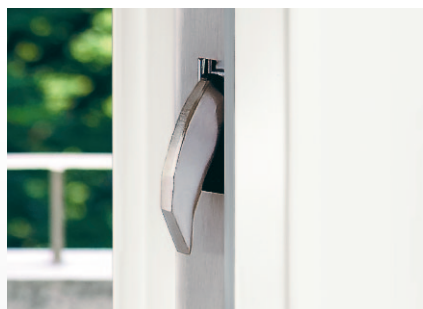
Standard Verriegelung M2 3-fach mit zwei Schliesshaken