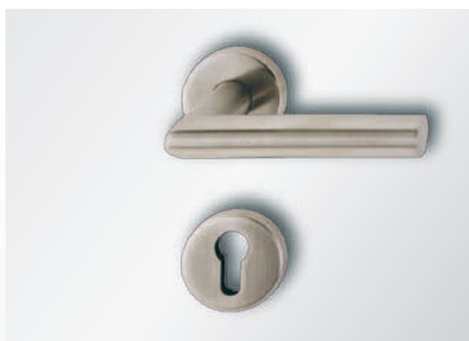
Edelstahl-Innendrücker GE504 (standard)

Beschlag Edelstahl Stossgriff, Edelstahl Innendrücker GE504 und Aussenrosette