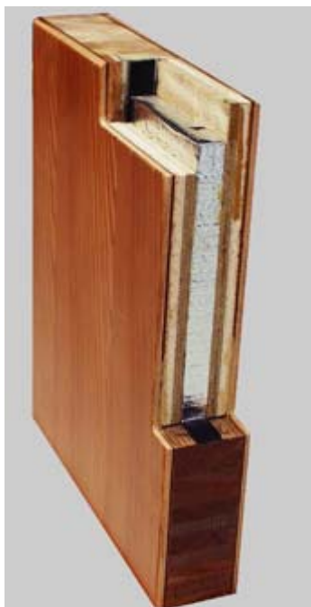
Bild VIP Paneele