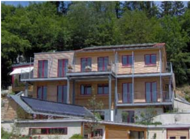
Bild: Weltweit erstes Nzullenergiehaus mit VIP

BU: An einem Hanggrundstück in Voggenthal, nahe der oberpfälzischen Stadt Neumarkt gelegen, erhebt sich seit Ende letzten Jahres das weltweit erste vakuumgedämmte Nullheizenergiehaus von VARIOTEC.